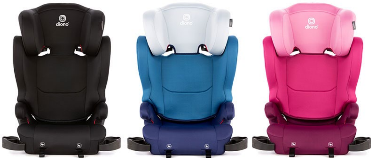
CAMBRIA 2 – NOIR CODE DE PRODUIT – 31200-CA-01

Le présent avis vous est envoyé conformément aux exigences de la Loi sur la sécurité automobile. La présente a pour but de vous informer que votre ensemble de retenue ou siège d'appoint est susceptible d'être non conforme aux exigences du Règlement sur la sécurité des ensembles de retenue et des sièges d'appoint (véhicules automobiles) et que la non-conformité pourrait porter atteinte à la sécurité humaine. – Rappel de Transports Canada no. 2021-190.