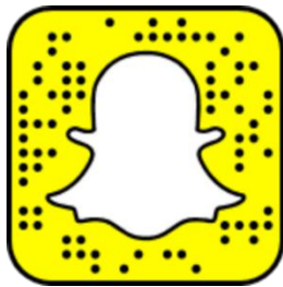
Snapcode Marker Tech

Pour découvrir Toys"R"Us Canada à travers la lentille Snapchat Portal Lens, il vous suffit de télécharger l’application Snapchat pour iOS ou Android et de scanner le code Snap ici: